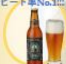
ゴールデンエール