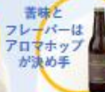
苦味とフレーバーはアロマホップが決め手 ピルスナー