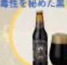
ブラウンポーター