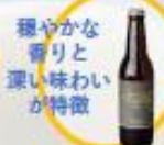
穏やかな香りと深い味わいが特徴 ベールエール